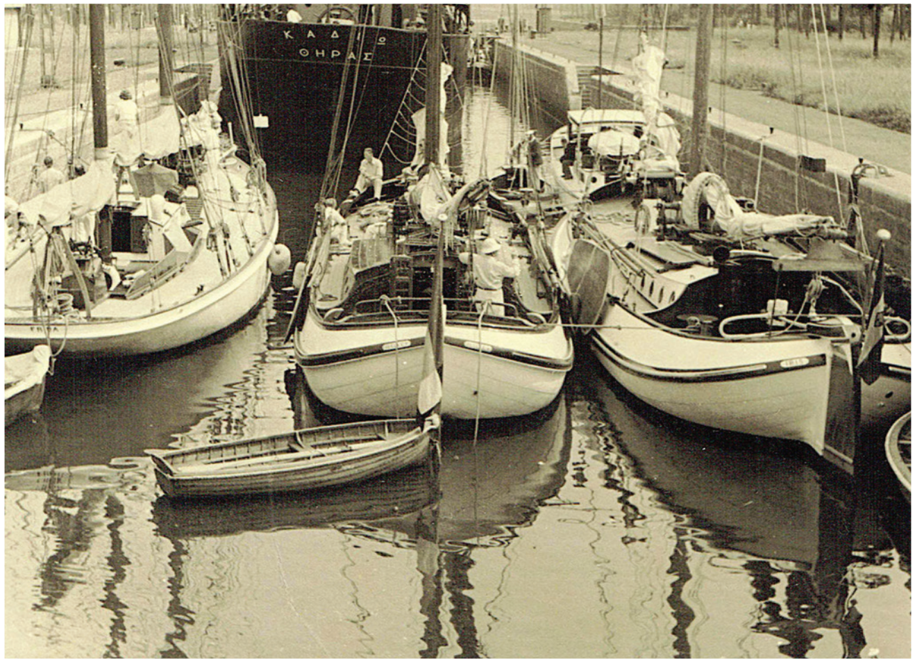
Ibis in de sluis stuurboordzijde.