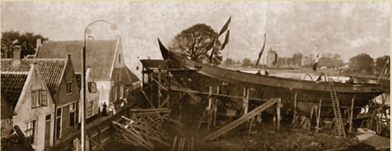
De eerste stalen botter die gebouwd werd op de werf van Schouten in 1906

zeevissers vanuit bijvoorbeeld Bunschoten, Nijkerk en Durgerdam.